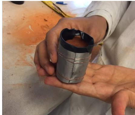
Figura 2. Celda de combustible, armada con recipiente de arcilla y recubierta con malla de acero inoxidable y cobre.