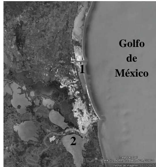
Figura 3. Área de estudio: 1. Marismas de Altamira, en Tamaulipas y 2. Pueblo Viejo en Veracruz.

Comprende las lagunas costeras de: Marismas de Altamira en Tamaulipas, y la de Pueblo Viejo en Veracruz (Figura 3).